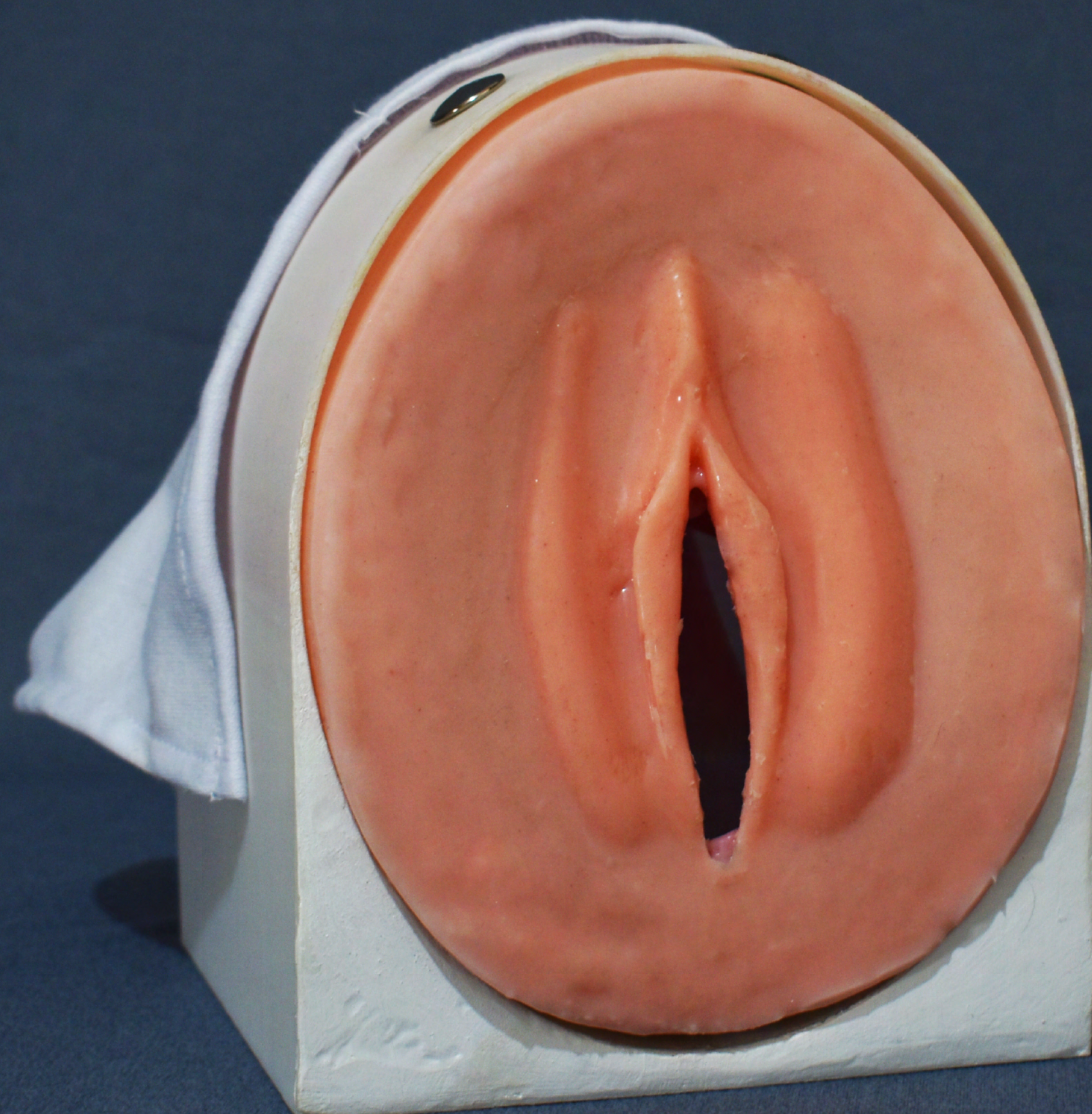
Diagrama de uso MODELO ANATÓMICO PARA TACTOS VAGINALES EN GESTANTES